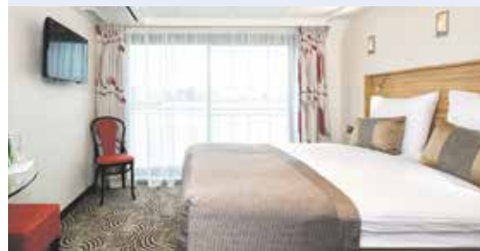
2-Bettkabine Mittel-/Oberdeck mit franz. Balkon

Rabatt Fr. 200.– bereits abgezogen, HD hinten