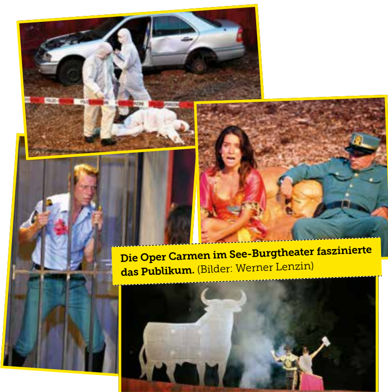
Die Oper Carmen im See-Burgtheater faszinierte das Publikum.