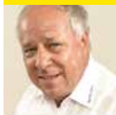
Harald Zecchin Veranstaltungen