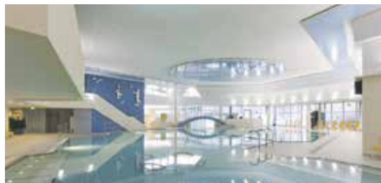
Wiesbaden, Thermalbad Aukammtal