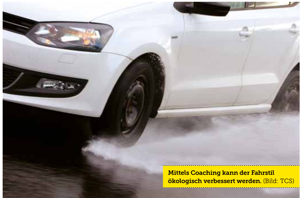
Mittels Coaching kann der Fahrstil ökologisch verbessert werden.

«DrivePlus» und die TCS Sektion Thurgau begrüßen Sie gerne vom 25. bis 29. September 2014 an der WEGA in Weinfelden. Besuchen Sie uns am Stand und erfahren Sie mehr über die Vorteile, die wir Ihnen zu bieten haben. Wir freuen uns darauf, Sie persönlich und individuell zu beraten. (mo)