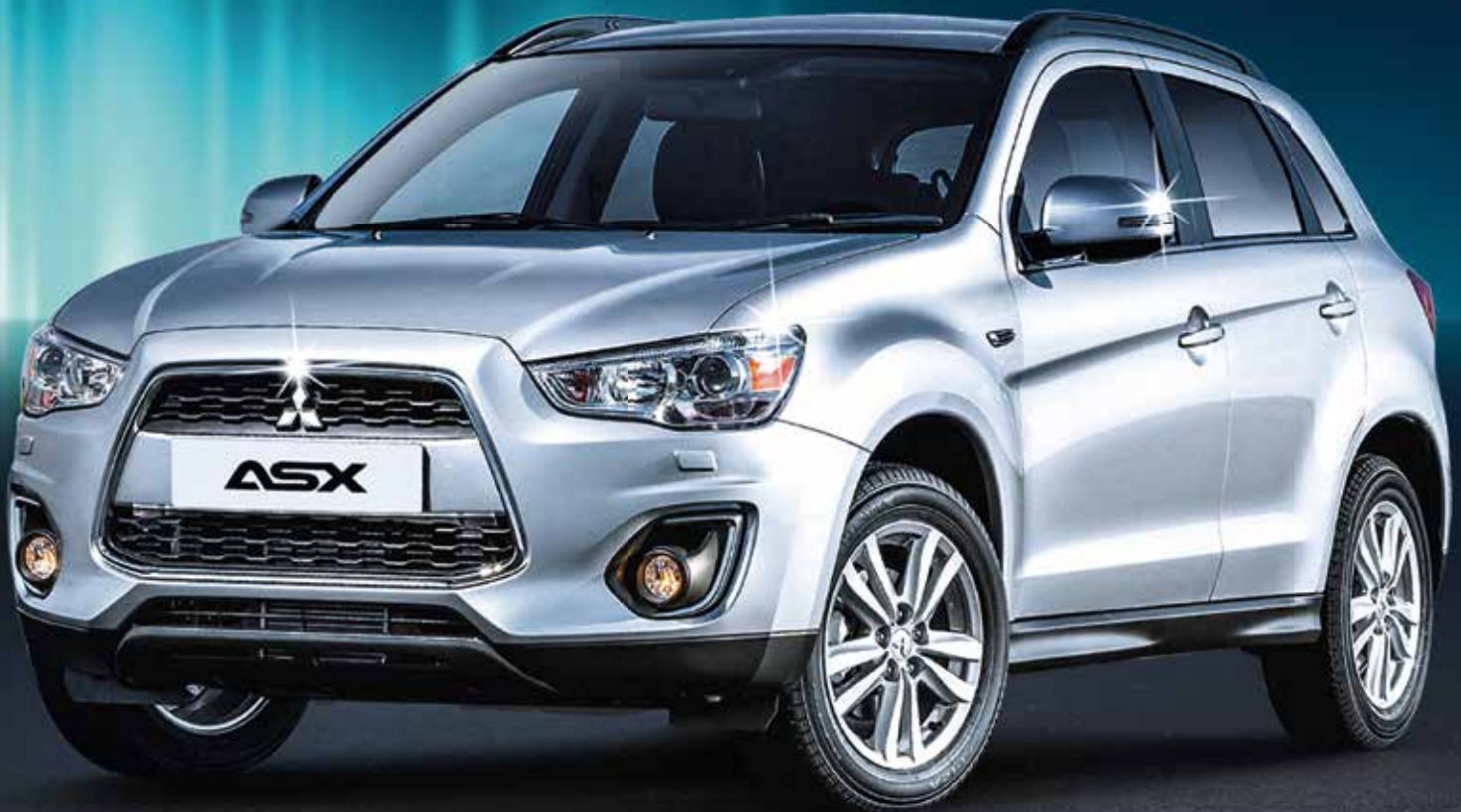
Abb. ASX 2.2 DID Navigator Automat, 4x4, 150 PS

Entdecken Sie die attraktive Mitsubishi Palette mit vielen neuen Modellen, vom City-Flitzer Space Star über den Compact Crossover ASX 4x4 (neu mit Automat), den Familien-SUV Outlander 4x4 bis zum Super-Sportwagen Lancer Evolution Turbo mit 295 PS oder die robusten 4x4 Zugfahrzeuge (ziehen bis 3.5 Tonnen) Pajero und L200 Pickup. Die Garage Krapf AG als neuer Mitsubishi Partner freut sich auf Ihren Besuch.