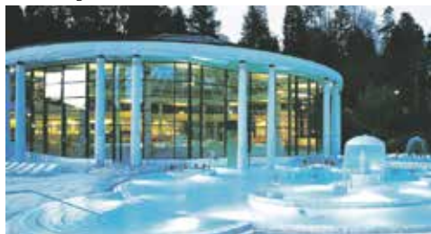
Baden-Baden, Caracalla Therme