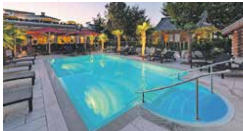
Bad Krozingen, Vita-Classica-Therme