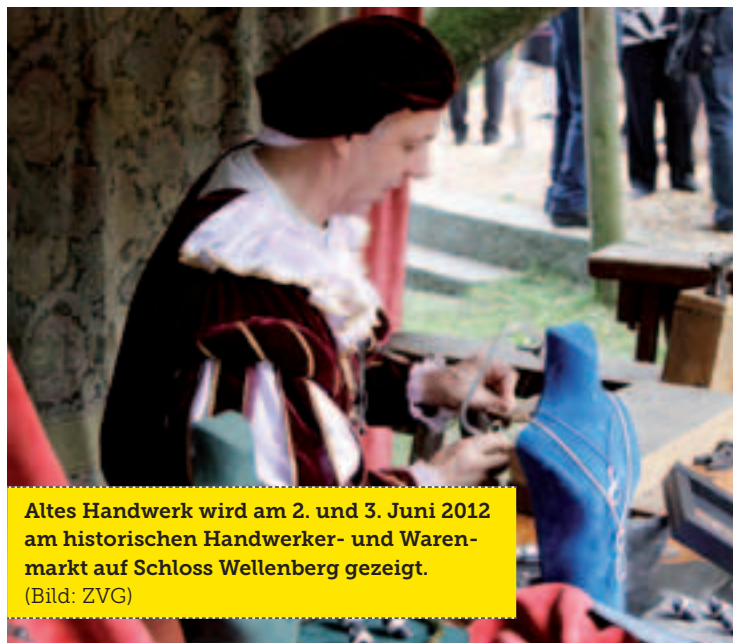
Altes Handwerk wird am 2. und 3. Juni 2012 am historischen Handwerker- und Warenmarkt auf Schloss Wellenberg gezeigt.

Laut Christof Schenkel hat es sich die im Jahre 2004 gegründete und selbständige Stiftung Schloss Wellenberg zur Aufgabe gemacht, die öffentlich zugängliche historische Substanz des Schlossgutes zu erhalten und zu fördern. «Dazu übernimmt sie die Kosten oder Kostenteile für Renovationen an Gebäuden und Einrichtungen sowie die Förderung, Unterstützung und Rückführung der historisch wertvollen Substanz an Gebäuden, Einrichtungen und Parkanlagen», sagt Schenkel. Als Beispiel erwähnt er die anstehende Renovation des Schlossdaches. Privatpersonen, Firmen und Institutionen unterstützen den Erhalt und die Förderung des Schlossgutes gemäss Stiftungszweck.