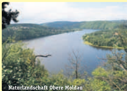
Naturlandschaft Obere Moldau

Das gemütliche Mittelklasseschiff wurde im Jahr 1980 erbaut und ab Frühjahr 2008 sanft renoviert. Es bietet 90 Gästen in 47 Kabinen bequem Platz. Alle Kabinen liegen aussen und verfügen über TV, Dusche/WC und Klimaanlage. Auf dem Oberdeck sind die Kabinen mit kleinen Klappfenstern und neu sechs Kabinen mit französischem Balkon ausgestattet. Im Restaurant mit Bar werden vom tschechischen Koch zubereitete internationale und nationale Speisen serviert. Kleine Lounge bei der Rezeption und Front-Aussichts-Salon mit Panoramafenstern auf dem Oberdeck. Das grosse Sonnendeck mit Stühlen und Liegen bietet Erholung und Entspannung. Nichtraucherschiff (Rauchen auf dem Sonnendeck erlaubt).