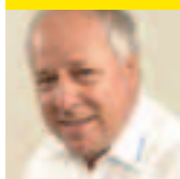
Harald Zecchin Veranstaltungen